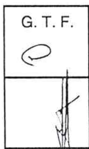
ENRIQUE MARCELO VALLEJOS Ministro de Coordinación de Gabinete y Gobierno